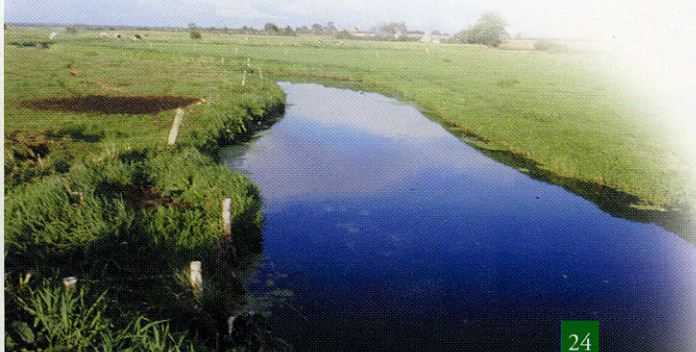
Gorges : La Sèves

Baigné par l'Holerotte descendue de Périers, le château de Basmarescq a conservé du XVI ème s. sa belle tour d'escalier tandis que ses façades, flanquées au nord d'une tourelle, furent remaniées au XVIII ème s.