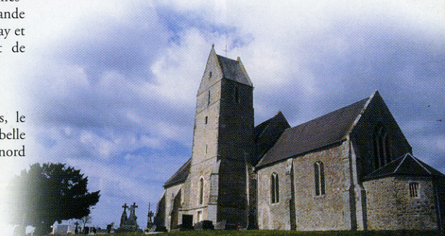
Gonfreville : l'église